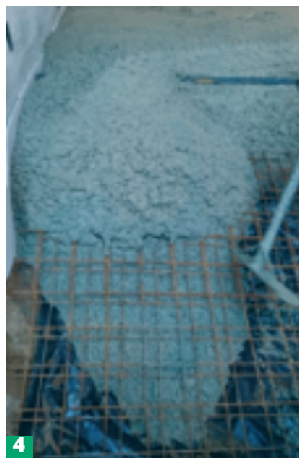
Fot. 3. Proces zacierania powierzchniowego posypki. Fot. 4. Efekt końcowy