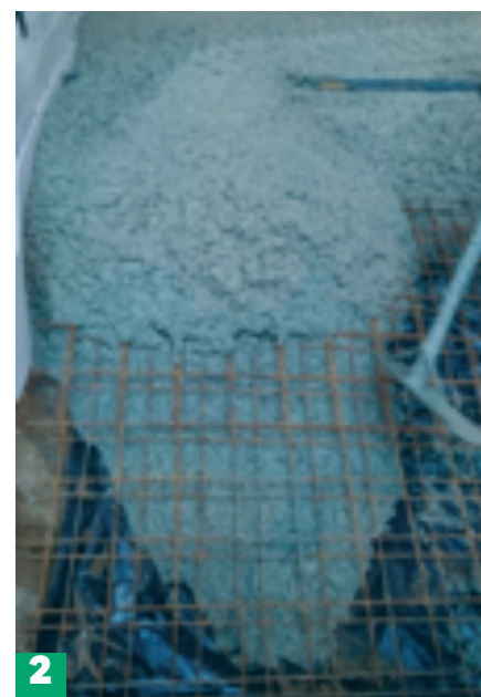
Fot. 1, 2. Proces układania mieszanki betonowej